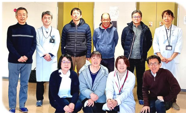
2月8日 スタッフ一同

ある施設の技師長の方は、タスクシフトの本質は、働き方改革よりチーム医療の一環で、臨床検査技師の存在を確固たるものに印象つける機会だと考えられる方もおられます。そこで問題となっているのが、他職種連携、検査部所内の連携です。